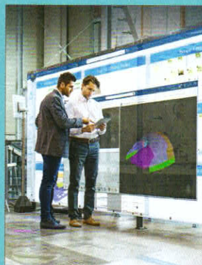
TITELBILD SPECIAL Dassault Systemes Deutschland GmbH, München